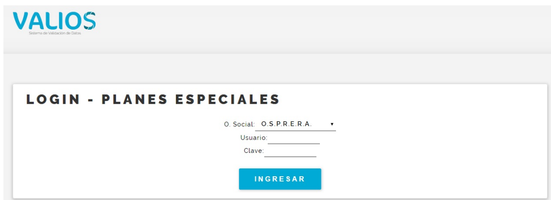
Fig. 2 Login de Ingreso