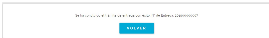
Fig. 16 Farmacia Entrega, confirmación

13) Ahora veremos en detalle la opción “Consulta Pedidos” del menú de insulinas – compra local (Fig. 3).