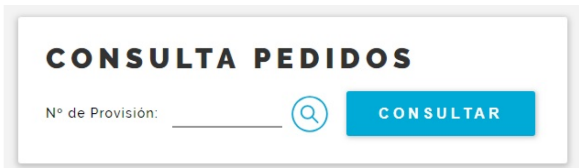
Fig. 17 Consulta Pedidos, paso 1

13) Ahora veremos en detalle la opción “Consulta Pedidos” del menú de insulinas – compra local (Fig. 3).