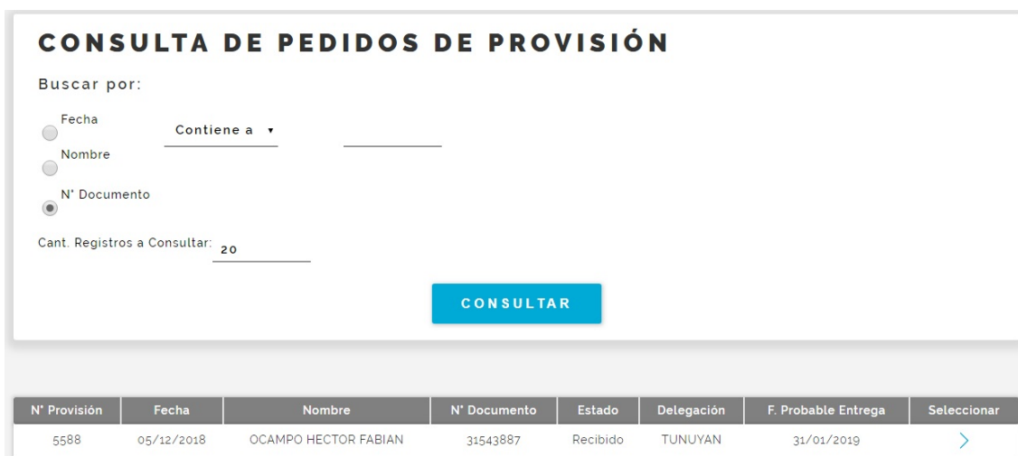
Fig. 9 Consulta de Pedidos de Provisión, Farmacia Entrega (Previa Recepción)