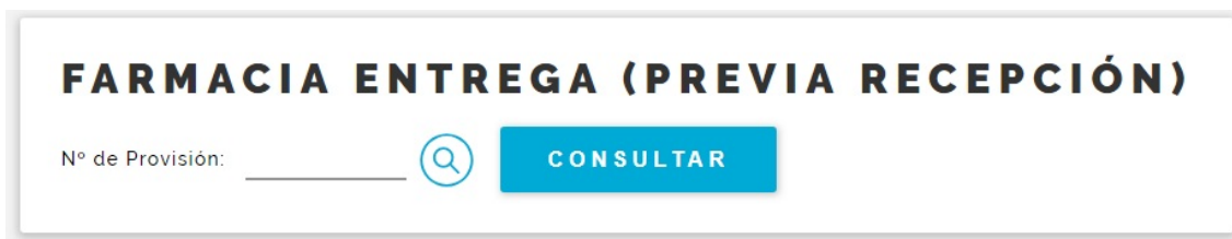
Fig. 8 Farmacia Entrega (Previa Recepción), paso 1