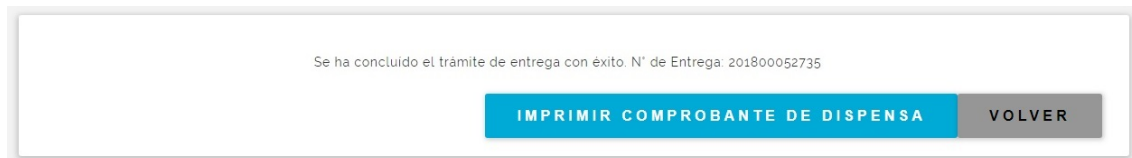
Fig. 10 Farmacia Entrega, confirmación

9) En la sección “Datos de la Entrega” ingresamos el código de dispensa (solo números, los guiones se agregan automáticamente). El mismo lo suministra el beneficiario; si él no lo posee, se debe probar con el código “00-00-000” que ya figura ingresado por defecto. Si en cualquiera de los casos el código ingresado es incorrecto, se mostrará el mensaje correspondiente y el beneficiario deberá comunicarse con la boca de expendio para que le suministren el código correcto. Luego se ingresa el nombre, número de documento, domicilio y teléfono de la persona que retira, las observaciones y la fecha de entrega. En la sección “Detalle de lo Recibido” especificamos la cantidad a entregar y marcamos la casilla “Seleccionar” en los medicamentos que se requiera (se pueden realizar entregas parciales), y por último presionamos el botón “Entregar”. Se mostrará un mensaje de confirmación o error, en caso satisfactorio se podrá imprimir un comprobante presionando el botón “Imprimir Comprobante de Dispensa”.